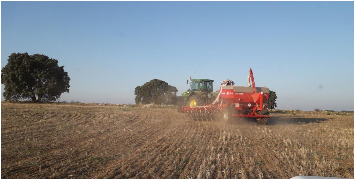
Fotografía 1: Siembra ensayo.