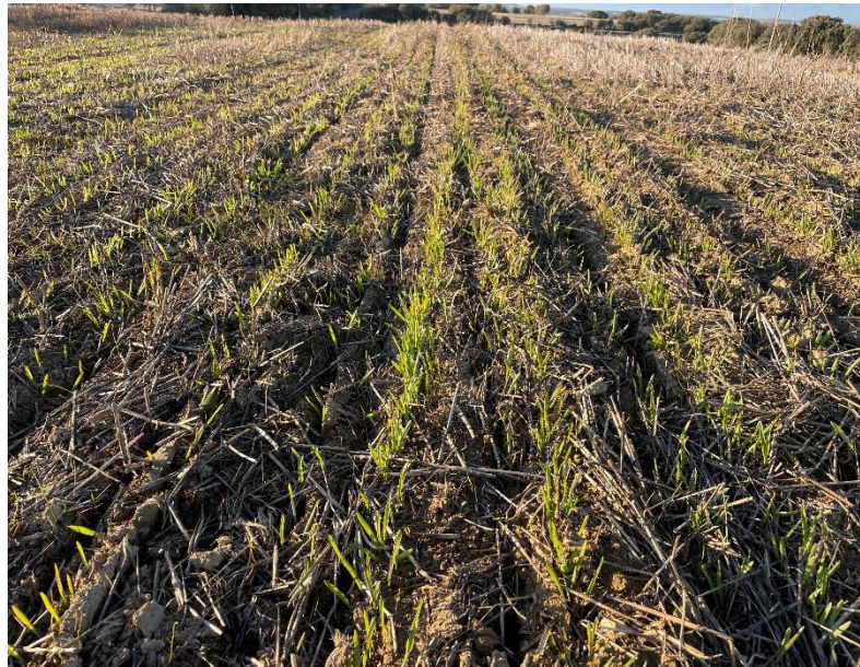
Fotografía 3: Nascencia cebada (12/01/2023)