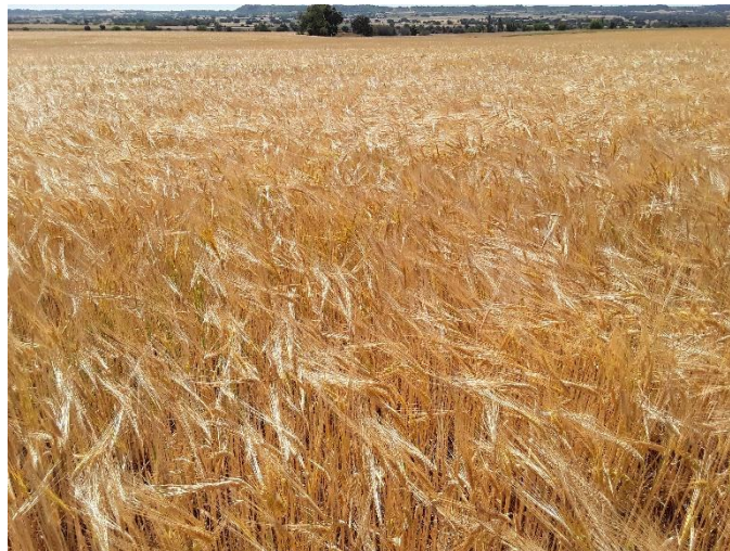
Fotografía 7: Estado fenológico (cebada 90 grano semiduro- duro). (22/05/2023)