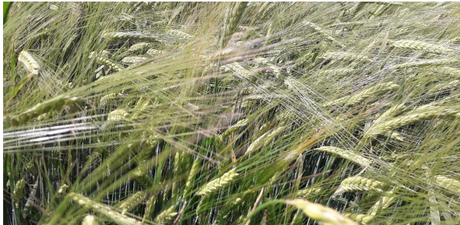
Fotografía 6: Estado fenológico (cebada 85 Lechoso - pastoso). (15/05/2023)