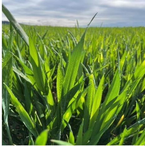
Fotografía 4: Estado fenológico (31- 32) Primer nudo visible (14/04/2023)