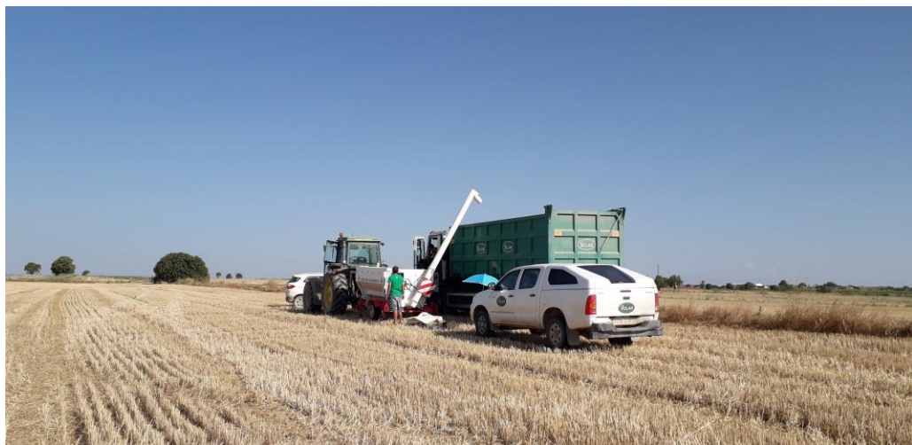
Fotografía 8: Cosecha (2/07/2023)